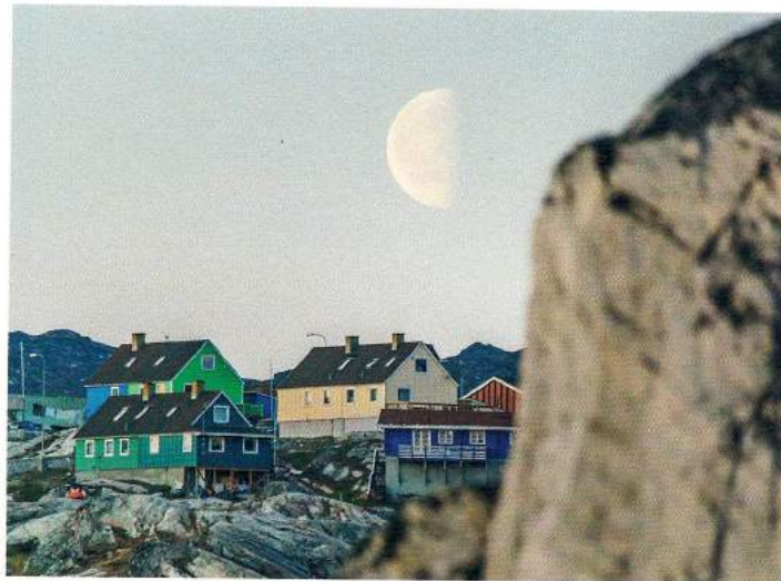
Ilulissats Häuser sind im dänischen Stil aus Holz erbaut und kunterbunt angestrichen.

dem Zwiebelprinzip in mehreren Schichten warm angezogen habe. So spüre ich die -15 Grad nicht so sehr. Das eisige, -10 Grad kalte Wasser ringsherum tut sein Übriges, um das Kälteempfinden eines Mitteleuropäers auf den Prüfstand zu stellen. Und das trotz strahlendem Sonnenschein. Doch die extremen klimatischen Bedingungen sind genau das, was Grönland ausmacht. Der Grönländer trägt Kleidung aus Robbenfell. Das schützt ganz sicher vor Kälte.