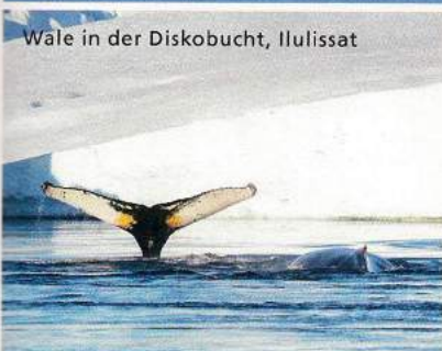
Wale in der Diskobucht, Ilulissat