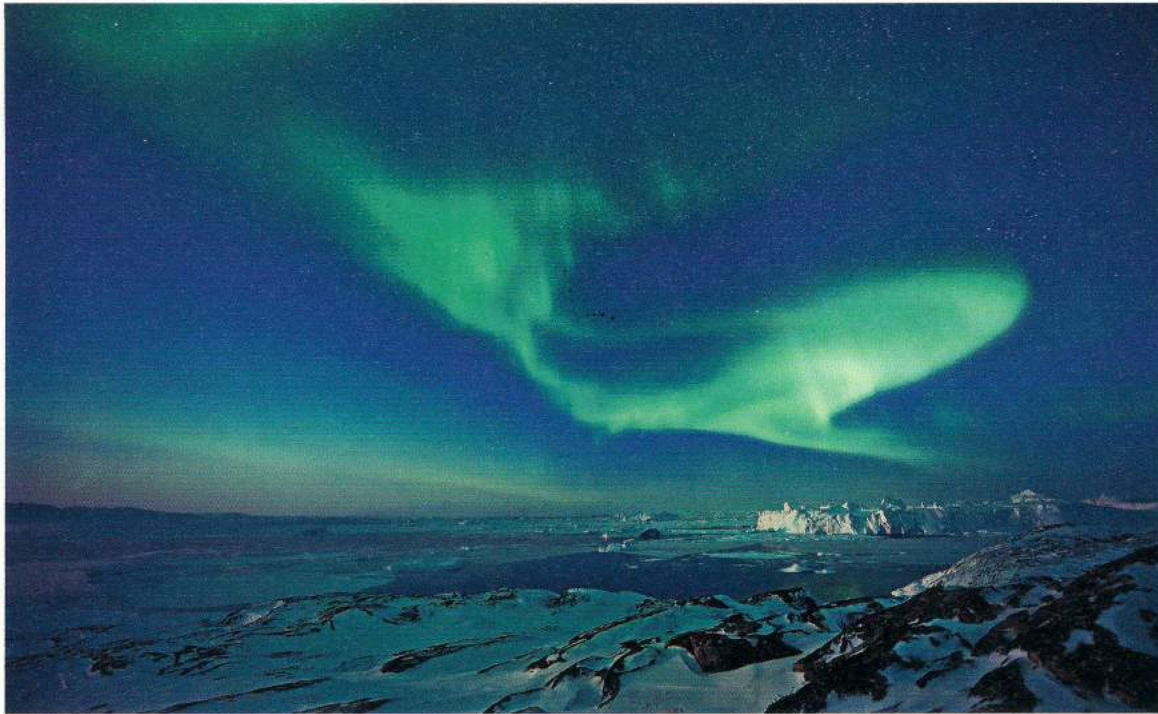
So romantisch sieht es aus, wenn elektrisch geladene Teilchen der Sonnenwinde in die Erdatmosphäre eintreten.

und klein kommt der Mensch sich inmitten der weißen Riesen vor, die gut 100 Meter in die Höhe schießen. Da krächzt eine Möwe, die den Gipfel des Eises umfliegt, die Wellen schwappen an das Boot. Stille – Erhabenheit – Unwirklichkeit. Während das Boot sich langsam wieder in Richtung Ilulissat-Hafen aufmacht, blicke ich wehmütig in den Sonnenuntergang, der nun die weißen Giganten in orange-rotes Licht taucht, bevor der Tag sich dem Ende neigt.