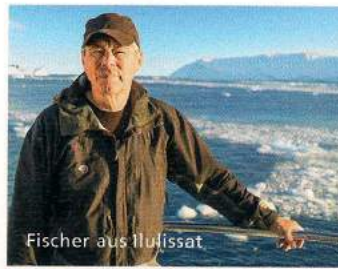
Fischer aus Ilulissat

Entdecken Sie die Welt auf AIDA Ausflügen.