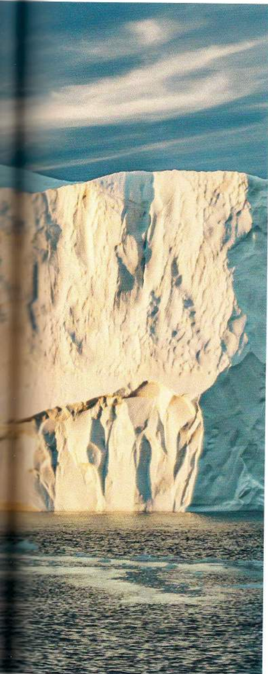
Der Gletscher Sermeq Kujalleq am Ende des Ilulissat-Eisfjords hat auch eine künstlerische Seite.